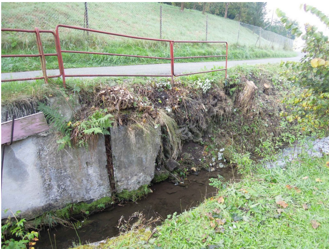
Obr. 2a, 2b – opěrná zeď na levém břehu vodního toku Ledhujka na pozemku p.p.č. 1017/15 v k.ú. Velká Ledhujka – v pozadí vozovka na ulici Ke Koupališti, září 2021