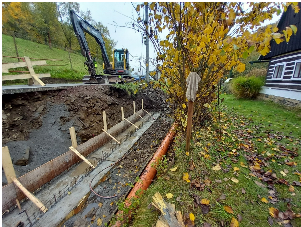
Obr. 1 – - Realizace betonových základů nové opěrné zdi na levém břehu vodního toku Ledhujka v blízkosti silničního mostku v ul. Ke Koupališti