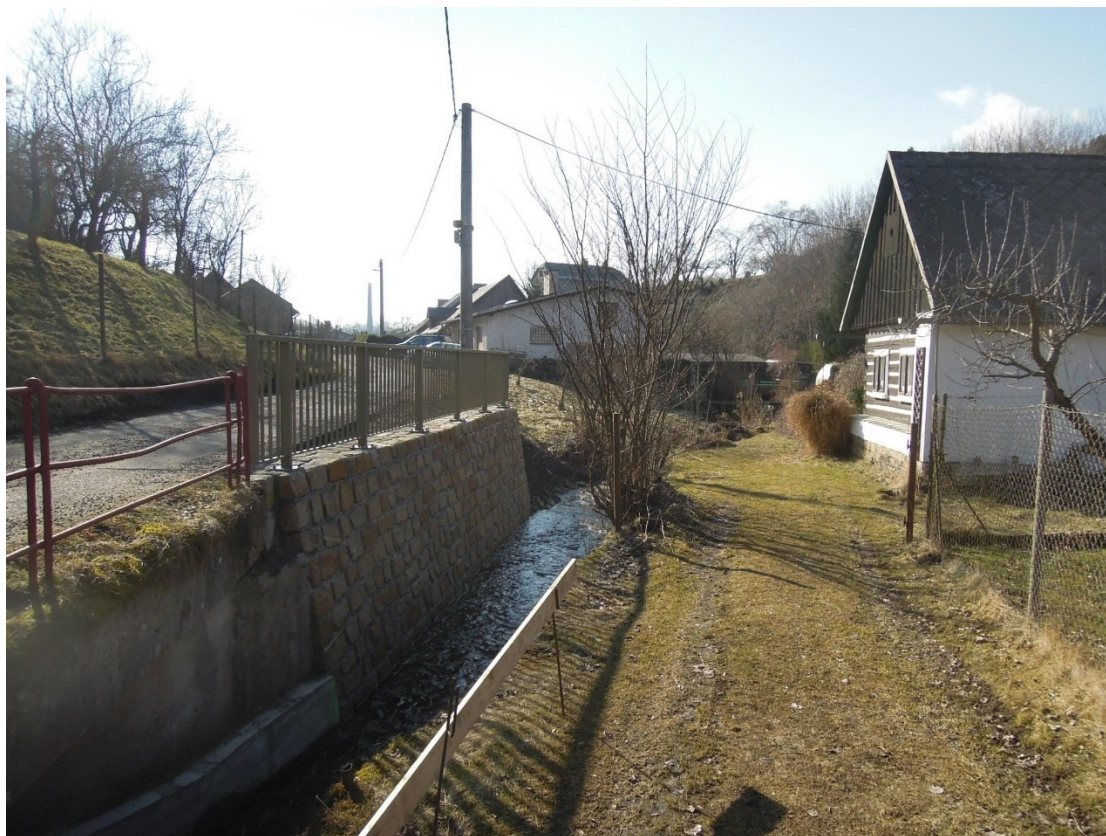
Obr. 6b – – stav po dokončení stavby začátkem března 2026